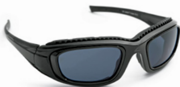
CZARNY Szary (zabarwienie 80–85%) 45 112 1010