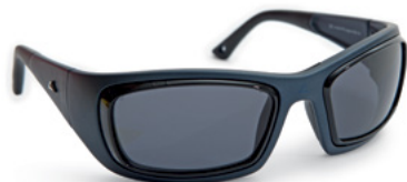
GRANATOWY MATOWY Szary (zabarwienie 80–85%) 45 113 3010