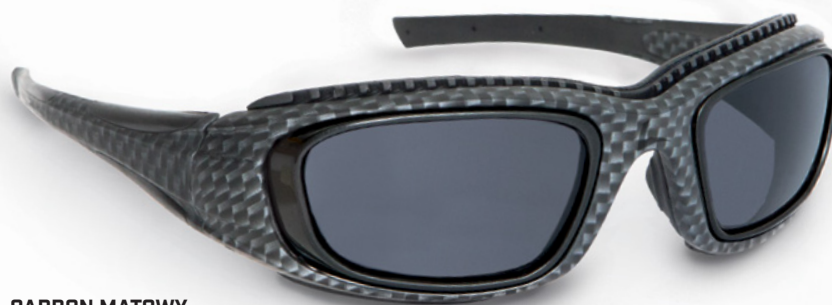
CARBON MATOWY Szary (zabarwienie 80–85%) 45 112 4010