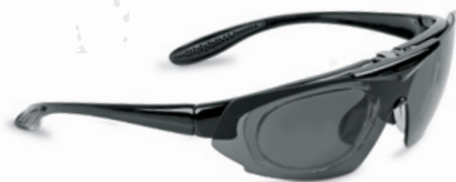
CZARNY Szary (zabarwienie 80–85%) 45 401 1010

WIELOFUNKCYJNA UNOSZONA NASADKA WYKONANA Z POLIWĘGLANU