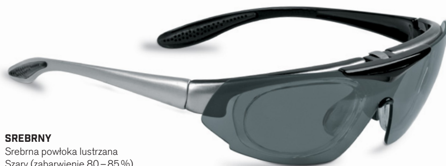
SREBRNY Srebrna powłoka lustrzana Szary (zabarwienie 80–85%) 45 401 2010