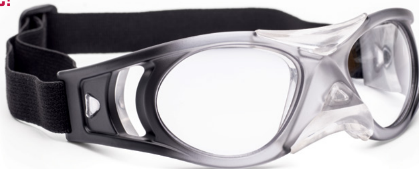
GRADIENT MATOWY CZARNY 45 400 1210