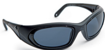
CZARNY MATOWY Szary (zabarwienie 80–85%) 45 114 1010