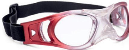
GRADIENT MATOWY CZERWONY 45 400 1410