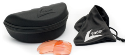
W ZESTAWIE ETUI, WORECZEK Z MIKROFIBRY I 1 PARA POMARAŃCZOWYCH SOCZEWEK