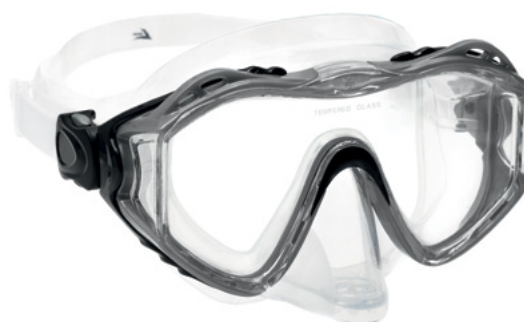
SREBRNY 33 750 1001