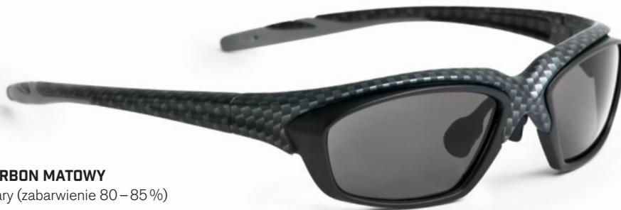
CARBON MATOWY Szary (zabarwienie 80–85%) 45 404 3010