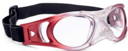
GRADIENT MATOWY CZERWONY 45 400 2410