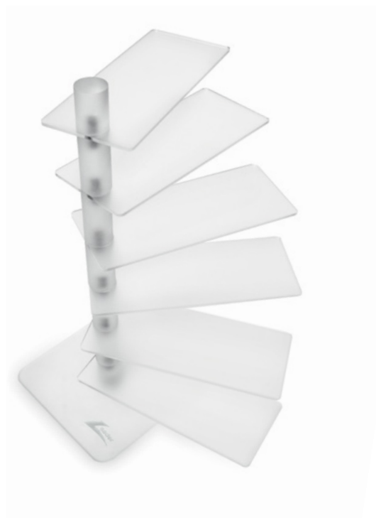
AKRYLOWY EKSPOZYTOR NA 6 OPRAW, 350 x 360 x 150 mm L000019