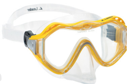
ŻÓŁTY 33 850 1001