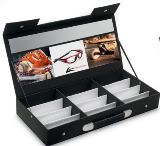
WALIZKA DO PREZENTACJI, BEZ ZAWARTOŚCI z lustrem wewnętrznym, na 12 opraw L000007