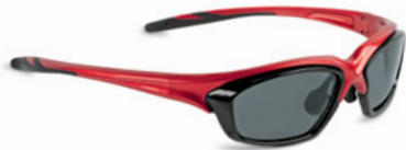
CZERWONY Szary (zabarwienie 80–85%) 45 404 2010