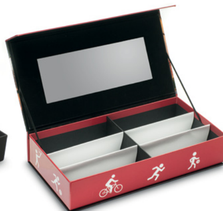
WALIZKA DO PREZENTACJI, BEZ ZAWARTOŚCI z lustrem wewnętrznym, na 6 opraw L000023