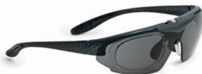
CARBON MATOWY Szary (zabarwienie 80–85%) 45 401 3010