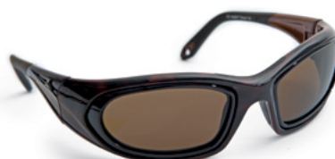
SZYLKRETOWY BŁYSZCZĄCY Brązowy (zabarwienie 80–85%) 45 114 2010