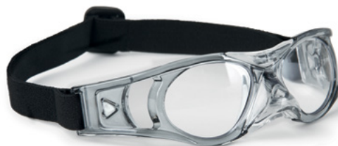
PRZYDYMIONY SZARY 45 400 2110