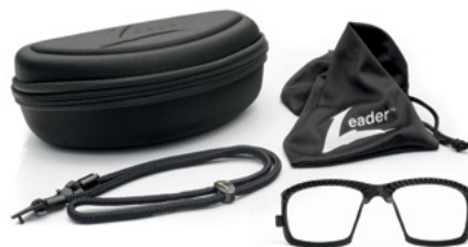
W ZESTAWIE ETUI, WORECZEK Z MIKROFIBRY, OPASKA NA GŁOWĘ I ADAPTER Z BAZĄ 6