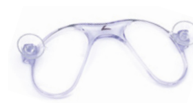
ADAPTER 33 850 9000