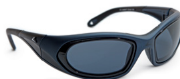
GRANATOWY MATOWY Szary (zabarwienie 80–85%) 45 114 4010