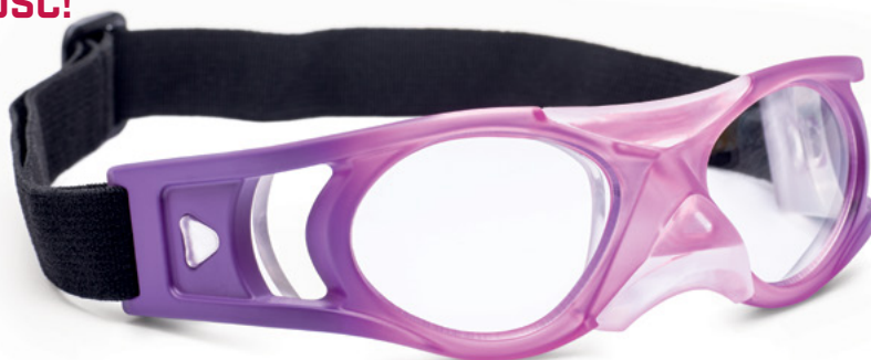
MATOWA FUKSJA/FIOLETOWY 45 400 2610