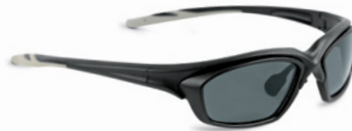
CZARNY MATOWY Szary (zabarwienie 80–85%) 45 404 1010