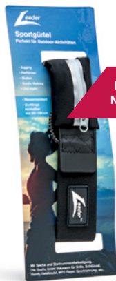
PASEK SPORTOWY L000003