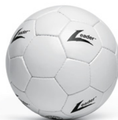
PIŁKA NOŻNA L000001