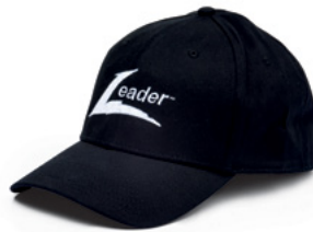
CZAPKA BASEBALLOWA Rozmiar S/M L000015