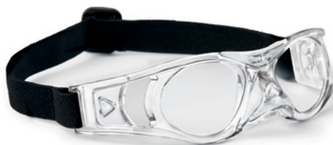
BEZBARWNY 45 400 1010