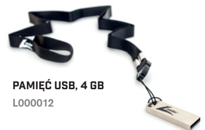
PAMIĘĆ USB, 4 GB L000012