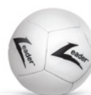
MINI PIŁKA NOŻNA L000018