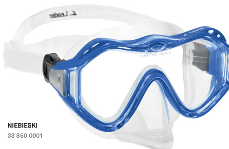
NIEBIESKI 33 850 0001