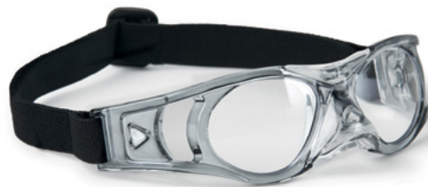
PRZYDYMIONY SZARY 45 400 1110