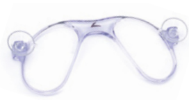
ADAPTER 33 750 9000