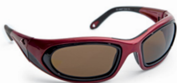
CZERWONY BŁYSZCZĄCY Brązowy (zabarwienie 80–85%) 45 114 3010