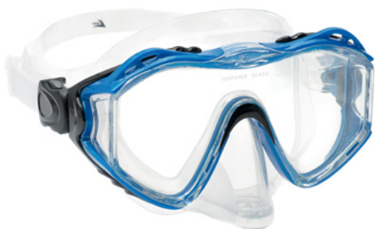
NIEBIESKI 33 750 0001