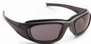
BRĄZOWY Brązowy (zabarwienie 80–85%) 45 112 3010

Z WKŁADKĄ PRZECIWPYŁOWĄ EVA DO SPORTÓW MOTOROWYCH I WODNYCH