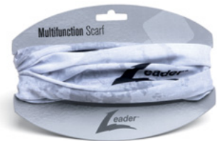
OPASKA WIELOFUNKCYJNA Szary L000002