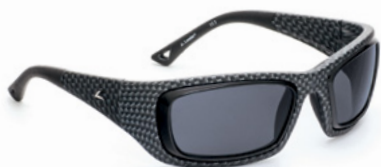
CARBON MATOWY Szary (zabarwienie 80–85%) 45 113 4010