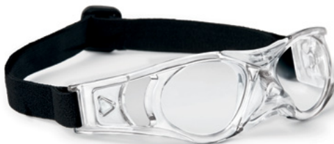
BEZBARWNY 45 400 2010