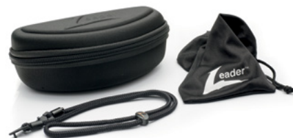
W ZESTAWIE ETUI, WORECZEK Z MIKROFIBRY I OPASKA NA GŁOWĘ