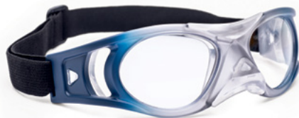
GRADIENT MATOWY NIEBIESKI 45 400 1310