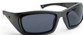
GRAFITOWY METALICZNY MATOWY Szary (zabarwienie 80–85%) 45 113 2010