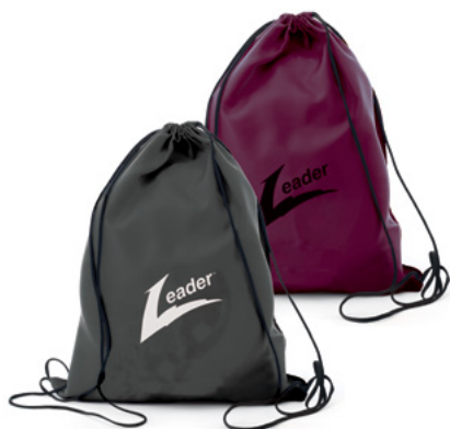
PLECAK NA SZNURKI ŚCIĄGAJĄCE Czarny L000010 Kasztanowy L000011