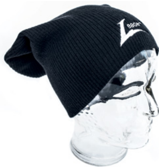
CZAPKA Czarny L000017