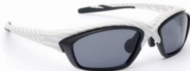
BIAŁY/CARBON Szary (zabarwienie 80–85%) 45 404 4010