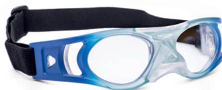
MATOWY JASNONIEBIESKI/NIEBIESKI 45 400 2510