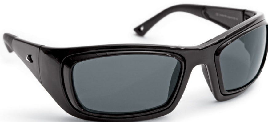
CZARNY BŁYSZCZĄCY Szary (zabarwienie 80–85%) 45 113 1010