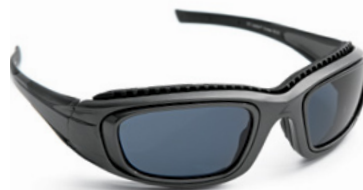
GRAFITOWY METALICZNY BŁYSZCZĄCY Szary (zabarwienie 80–85%) 45 112 2010