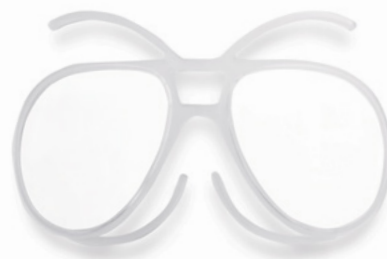
POLIWĘGLAN 46 100 2000